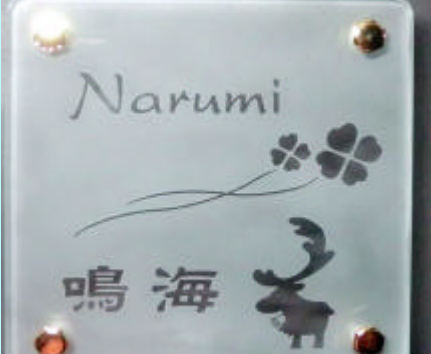
No.8 # 380

タイル無し一枚ガラス。透明部分から取り付け壁面の色が透けて見えます。濃い色の方がしっかりと文字類が読めます