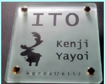
No.7 # 385

タイル無し一枚ガラス。透明部分から取り付け壁面の色が透けて見えます。濃い色の方がしっかりと文字類が読めます