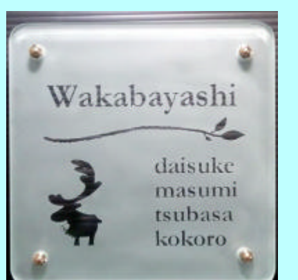
No.5 # 430

タイル無し一枚ガラス。透明部分から取り付け壁面の色が透けて見えます。濃い色の方がしっかりと文字類が読めます