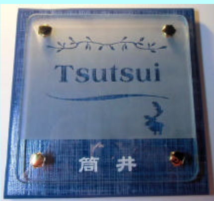
No.2 # 430

ブルータイルにガラスをセット。下部分は透明にしてタイルに彫刻した漢字の苗字が読めます。