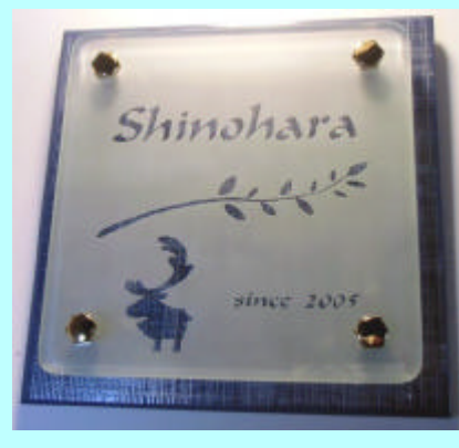
No.3 # 375

スリガラスのガラスにブルータイルをセット。透明の文字・飾り類からタイルの色が見えます。