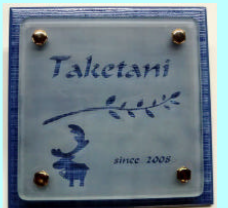
No.4 # 375

スリガラスのガラスにブルータイルをセット。透明の文字・飾り類からタイルの色が見えます。