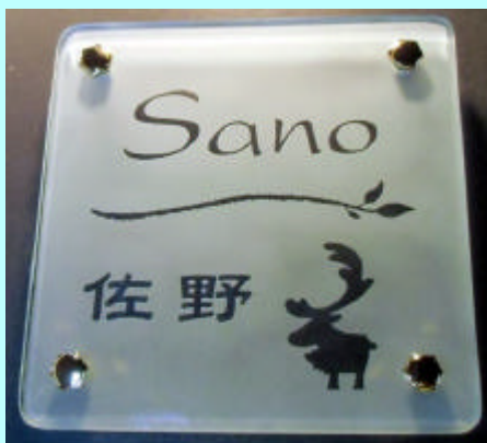
No.1 # 370

タイル無し一枚ガラス。透明部分から取り付け壁面の色が透けて見えます。濃い色の方がしっかりと文字類が読めます